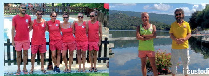
a cura dei Bagnini

Ha ricevuto parecchi apprezzamenti per via della nuova forma e della pavimentazione, il tutto incastonato in una nuova recinzione e circondata da un bellissimo prato verde che la fa risaltare e risplendere ancora di più. Sono inoltre continuati i corsi di nuoto offerti dalla Società che, come l'anno passato, hanno ottenuto grande riscontro e apprezzamento. I bagnini, come tutti gli anni, ringraziano per la fiducia ed il supporto il Consiglio Direttivo.